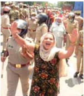
नोएडा प्राधिकरण कार्यालय के बाहर प्रदर्शन करती महिला को पकड़कर ले जाती पुलिसकर्मी।